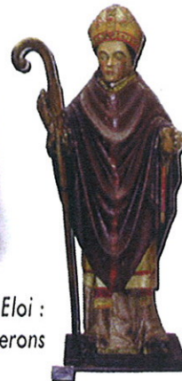
Saint Eloi : patron des forgerons