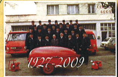
par Patrimoines et Mémoires Gueugnonnais

◆ "Sauver ou périr" Hommage aux sapeurs pompiers de Gueugnon