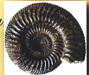
par Minéraux et Fossiles du Val de Loire et d'Arroux